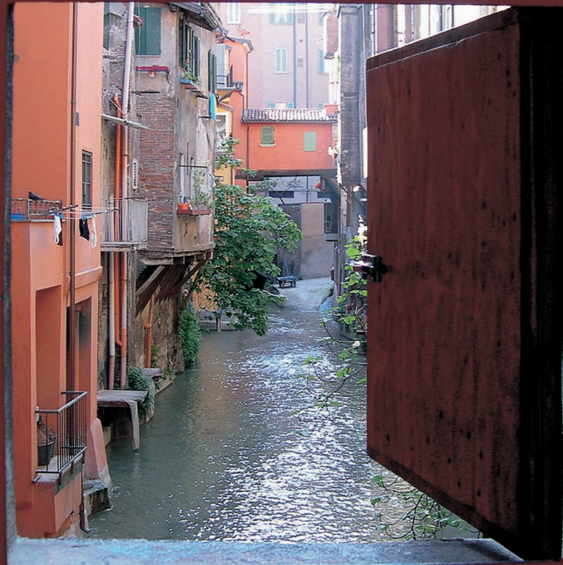
La ville de Bologne doit son surnom de La Rossa aux nombreuses façades et toits qui la colorent en rouge.