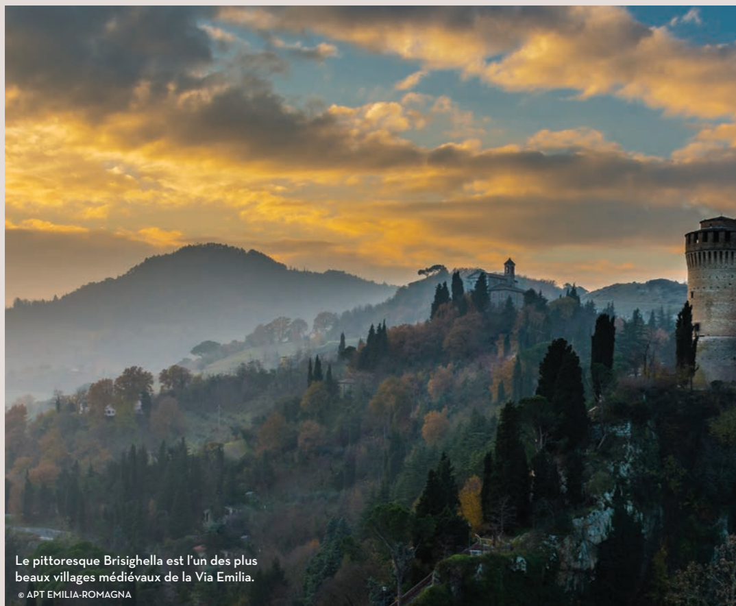
Le pittoresque Brisighella est l'un des plus beaux villages médiévaux de la Via Emilia.

Étape suivante : la région de Forlì-Cesena , qui déroule des paysages à couper le souffle, des Apennins à la côte de Cesenatico. On goûte au passage le Squaquerone, un fromage à pâte molle séculaire classé DOP, qui accompagne à merveille l'exquise piadina.